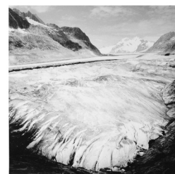
Textes Élisée Reclus Photographies André Bonaventure

Autre parution d'André : Pyénées – Fragment d'éternité , avec des poèmes de Georges Del Castillo - 2008